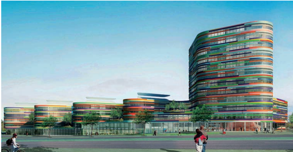
Entwurf der Berliner Architekten Sauerbruch Hutton