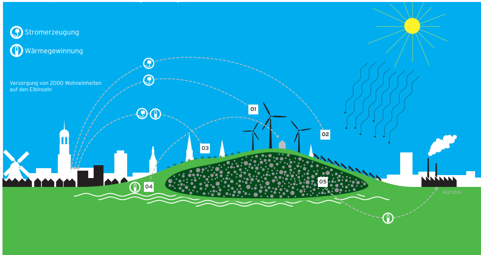
Planung für den Energieberg