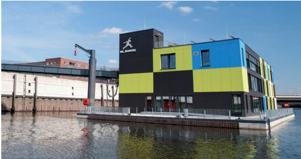
Das IBA DOCK im Muggenburger Zollhafen (Entwurf: Prof. Han Slawik)