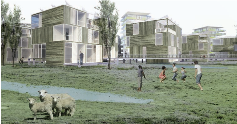
Im Einklang der Landschaft entstehen attraktive Wohnräume am Südrand des Gartenschaugeländes