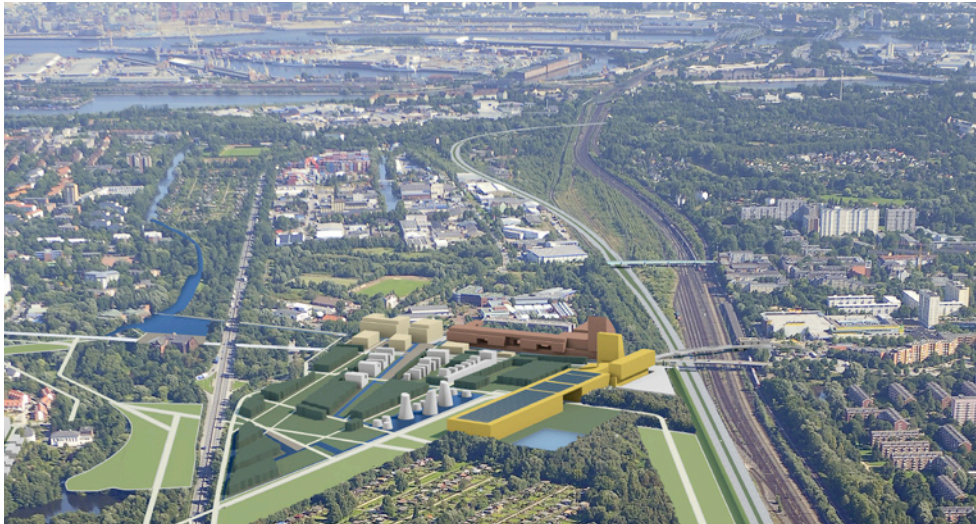
Visualisierung des Siegerentwurfs der Planergemeinschaft Jo Coenen Architekten und Agence Ter Landschaftsarchitekten