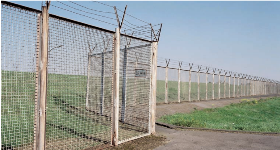
Die Öffnung des Stadtteils zum Wasser hin soll durch den Abbau des Zollzauns gelingen