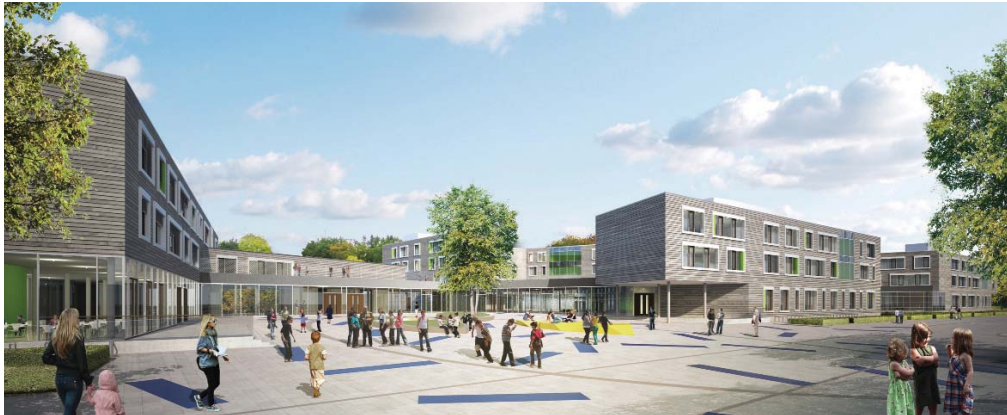
Der Siegerentwurf des städtebaulichen Wettbewerbs schafft abwechslungsreiche Außenräume, die alle Teile des neuen Bildungszentrums gekonnt zusammenfügt