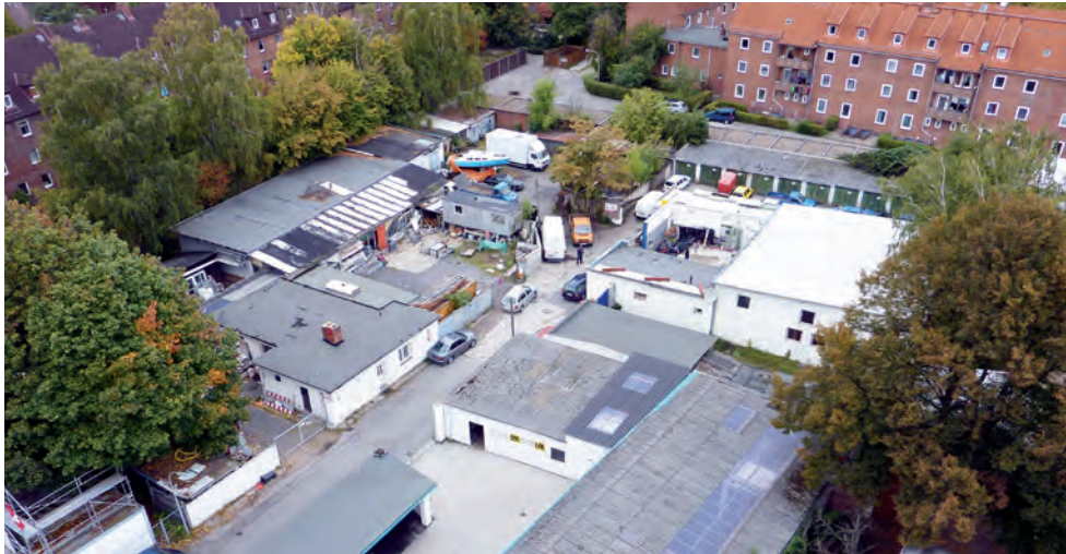
Unmittelbar südlich des Weltquartiers wird der bestehende Gewerbehof qualifiziert und weiterentwickelt.